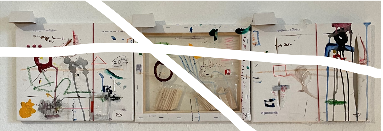
PIF 1-3 oder 3-1, PLASTIC IS FANTASY 27x90,5cm Mischmedia 2022